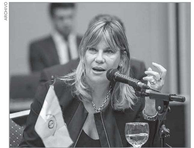
GABUR. La Ministra de Industria, Trabajo y Comercio brindó un panorama sobre la situación industrial en Corrientes.

La prioridad del Gobierno provincial, subrayó la Ministra, son los puestos de trabajo: "Estamos gestionando también ahí, pero justamente porque estamos preocupados en que los puestos de trabajo", sostuvo, modo a través del cual dejó implícito el compromiso del Ejecutivo provincial con la preservación del empleo en la región.