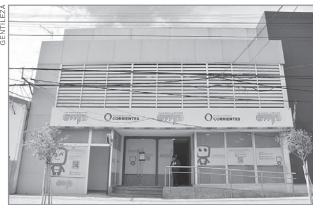
CAJA MUNICIPAL DE PRÉSTAMOS. Los agentes Neike deberán acudir entre el lunes y el miércoles, según su DNI.

Existe un segmento específico de agentes Neike que, si bien se encuentran bancarizados, todavía no poseen en su poder la tarjeta de débito física para