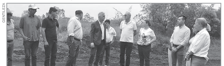
WALTER CHÁVEZ. El Ministro de Producción valoró el alcance y las positivas consecuencias que tendrán las obras.

el impacto estratégico de la conectividad vial en el agregado de valor y la generación de nuevas fuentes de trabajo genuino. "Cada kilómetro que mejoramos con el Gobierno de Co-