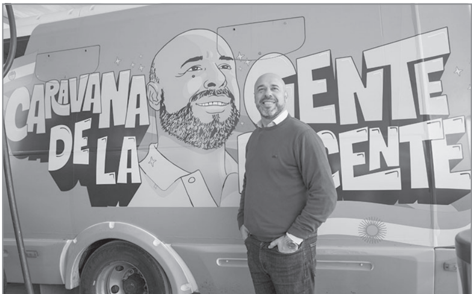
TIEMPO DE REFLEXIÓN. El justicialista ya piensa en el nuevo panorama provincial.