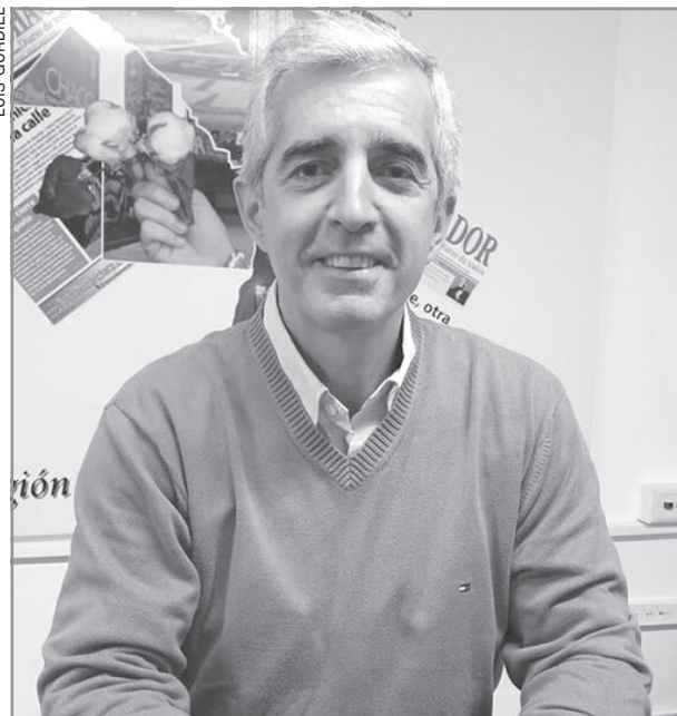
AGRIDULCE. A pesar de la derrota, logran una banca.

tacó que su elección es el resultado del trabajo colectivo y de la coherencia en la defensa de sus convicciones: "Siempre dije que