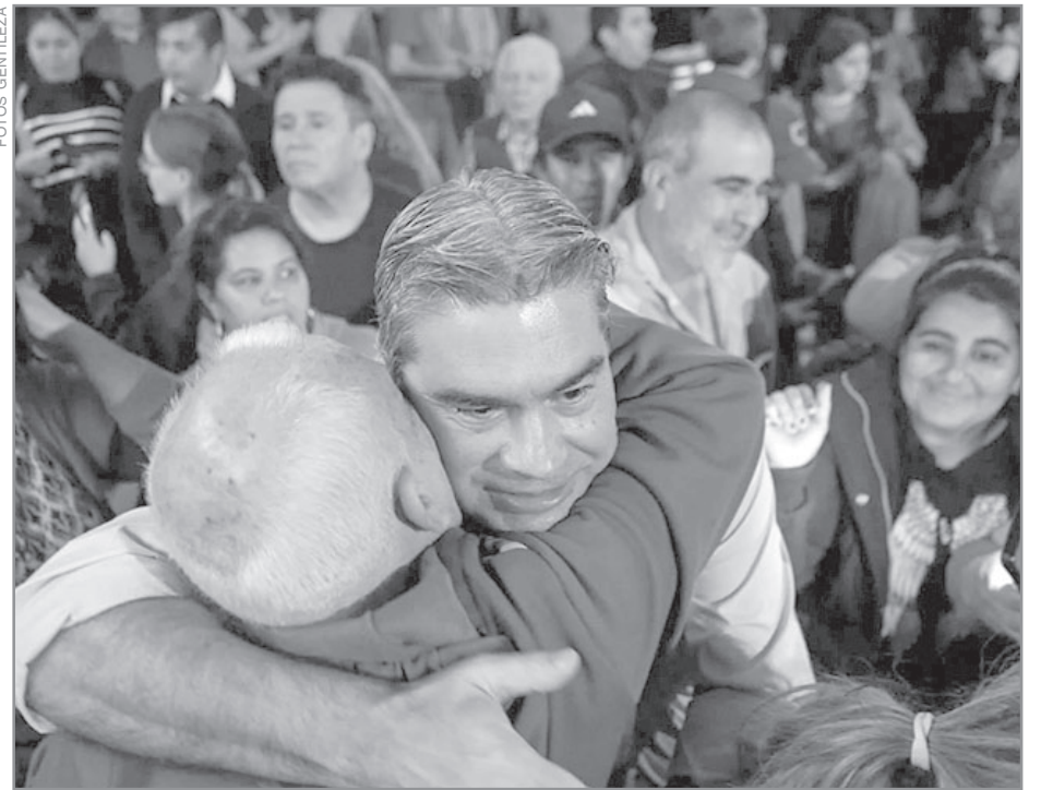
EN DEFENSA DE LA NACIÓN. Capitanich propuso reconstruir el peronismo como fuerza nacional para superar la fragmentación política y afrontar la crisis estructural de Argentina.

na tiene el predominio de 57 tecnologías críticas de acuerdo al Instituto de Política Estratégica de Australia, que es lo que lo sigue desde la desde el inicio del siglo. El resto lo tiene Estados Unidos y nosotros estamos fuera del mundo.