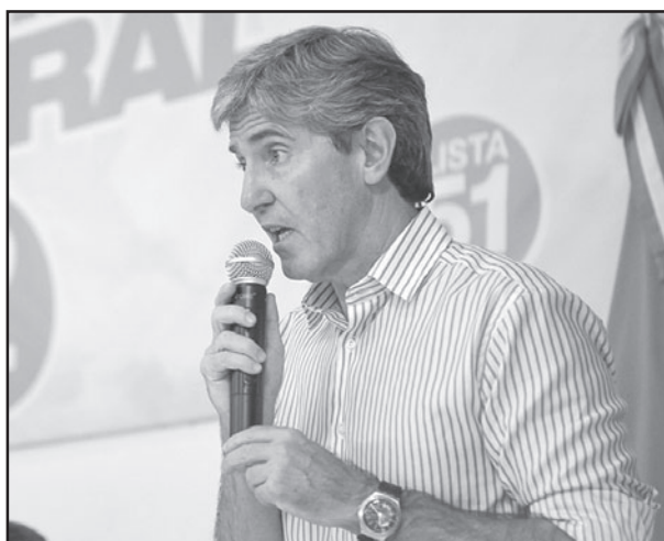
TAJANTE. El titular partidario se expresa sin titubeos.

"El compromiso del partido con la alianza está, es evidente porque somos parte del Gobierno, más allá de algunas personas con actitudes que