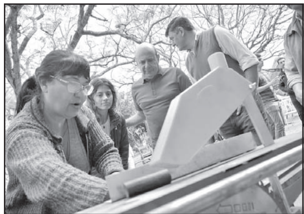
DE RECORRIDA. El ex Vicegobernador, sin pausa.