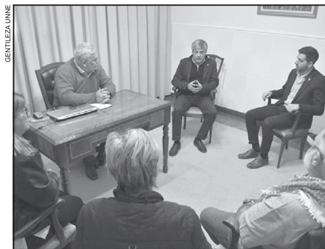
PROPUESTAS. Hubo compromiso de cooperación.

Zaninelli también valoró "la decisión política de continuar con las paritarias", en un contexto en el que existen universidades argentinas en las que no existe el espacio o se realizan de manera "antojadiza". "Es una mesa donde dialogan pares, en