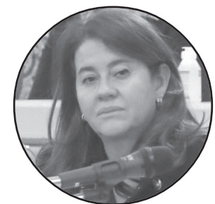
BUENA ONDA. La legisladora del PRO correntino optó por un mensaje en clave positivo.

Porque, para seguir progresando como sociedad es necesario garantizar la igualdad, participación y representación de las mujeres en política".