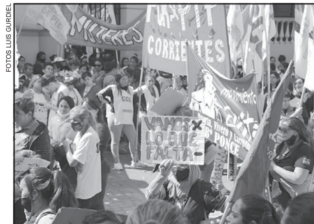
EXPECTATIVA. En la mañana de ayer, en la plaza 25 de Mayo frente a Casa de Gobierno y la Legislatura, ciudadanos se presentaron para apoyar la aprobación de la ley de paridad de género.