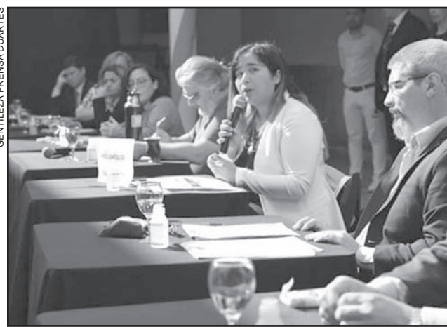
EXPOSICIÓN. La legisladora pejotista, con proyectos.

Por ello, la parlamentaria opositora puntualizó en redes sociales: "En la sesión itinerante del barrio