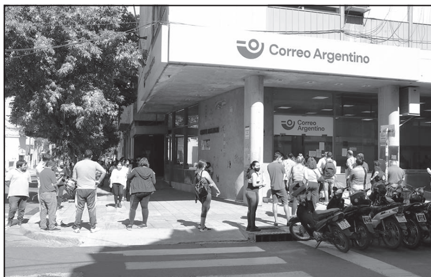
NUEVAS FUNCIONES. El viejo edificio del correo, ahora al servicio de la Justicia.