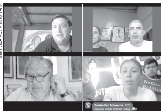
COMPROMISO. Encuentro de militancia nacional.

"Estas instancias de intercambio son importantes, más en estas circunstancias de emergencia dónde la información se bombardea de todos lados sin saber qué es verdad y qué no y dónde