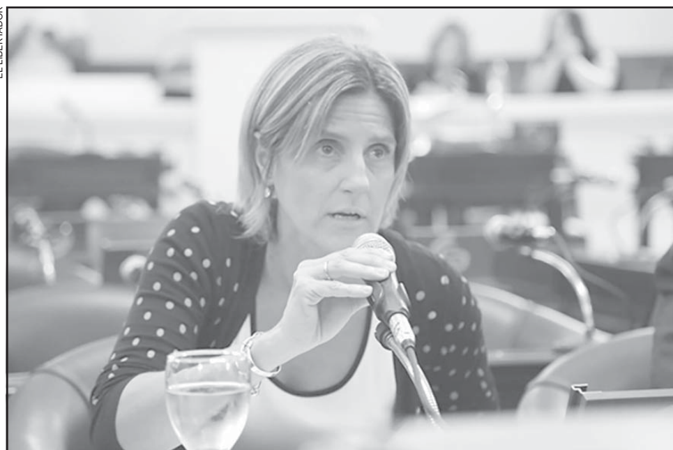
LOS PUNTOS SOBRE LAS ÍES. La Senadora del PJ no dudó en cuestionar el tardío accionar del Gobernador así como el reiterado ninguneo del Presidente de la Nación, algo que se tornó una costumbre. A Valdés, además, le reclamó autocrítica, dejando en claro que sus críticas son respecto a la gestión y no hacia su persona, a la cual guarda el merecido respeto.

primaria de Corrientes hoy está golpeada. El 11 por ciento del territorio provincial se quemó, el 20 por ciento del Iberá se quemó, pero los campos correntinos están afectados en un ciento por ciento por graves secuelas productivas que en el sector ganadero se verán por la falta de pasturas en vísperas del invierno. El desastre ecológico que tenemos es enorme y, repito, esto recién lo estamos empezando a ver. Tenemos que ver qué consecuencias va a traer, cómo podemos solucionarlo y si hay un problema que no tiene solución, cómo podemos hacer como para poder mejorarlo o acomodar todo esto. Este que es la creación del Ministerio de Ambiente, fue presentado por todo el bloque del Senado del PJ, ya que Corrientes, como bien decís, no tiene Ministerio de Medio Ambiente y ni siquiera tiene la Secretaría. Misiones en esto fue pionera. Lo tiene desde hace dos décadas. Esto nos demuestra que la Provincia no está preparada para afrontar un desastre semejante. Esto nadie lo puede negar. Creo que deberían acompañarnos.