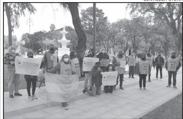
HACE TIEMPO. Manifestación en la plaza 25 de Mayo.

El Sindicato Único de Trabajadores de la Educación de Corrientes (Suteco) encabezará mañana una jornada provincial de Protesta Docente, que se desarrollará en los turnos mañana y tarde en todas las ciudades de Corrientes.