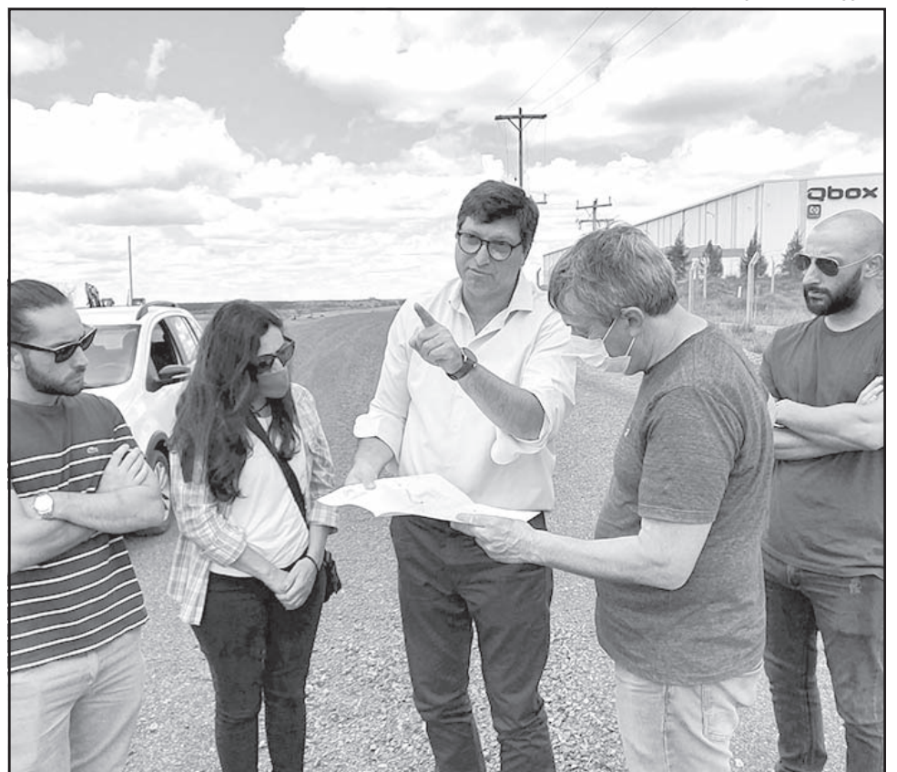
APUESTA PÚBLICA-PRIVADA. El funcionario remarcó la relevancia de este tipo de emprendimientos, en cuanto a lo que generará de manera directa e indirecta, tal el caso de los puestos de trabajo de calidad.