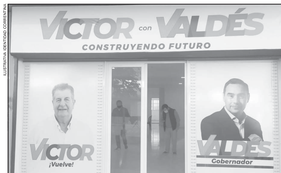
"CONFUCIÓN". Para Colombi, había una sola candidata oficialista. Sin embargo, los hechos mostraron al electorado que hubo otro postulante, el caso de Cemborain.

Es que Colombi nunca digirió que Gustavo Valdés haya habilitado a Víctor Cemborain para correr con los colores de la alianza que comanda el radicalismo. Es más, fue el primero en lanzarse al ruedo con toda la parafernalia del Gobierno en las calles mercedenses. Un marketing político importante que luego debió aplacarse, puesto que meses después Ricardo intentó hacer bailar su trompo mediante la postulación de una alfil