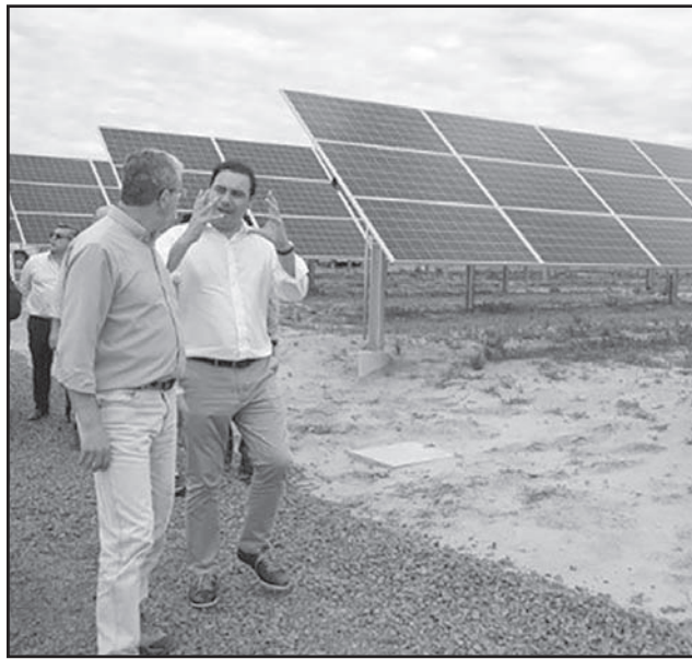
MARCO. Por el desarrollo sustentable y competitivo.

"Con la ley que crea el Fondo para Generación Distribuida para energías renovables, la provincia de Corrientes articula políticas claras y estables en el tiempo que permitan superar los desafíos y alcanzar el objetivo, logrando mayor competitividad y sustentabilidad en