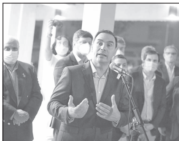
CUENTAS CLARAS. La premisa del Gobernador.

pensando en lo complejo que ha sido lograr equilibrar las balanzas manifestó: "Estamos peleando y tratando de tener un cierre equilibra-