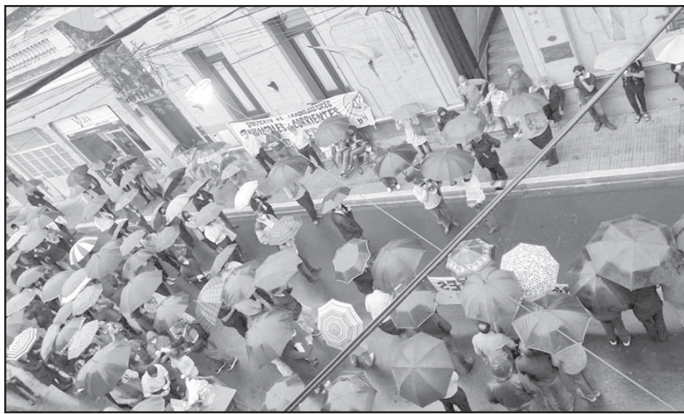
PROTESTANDO BAJO LA LLUVIA. Cubriéndose con paraguas, los empleados judiciales hicieron oír su voz. Exigen que se cumpla el aumento salarial ya otorgado.

"Pero, en esta oportunidad -agregan- es la primera vez en al menos dos décadas