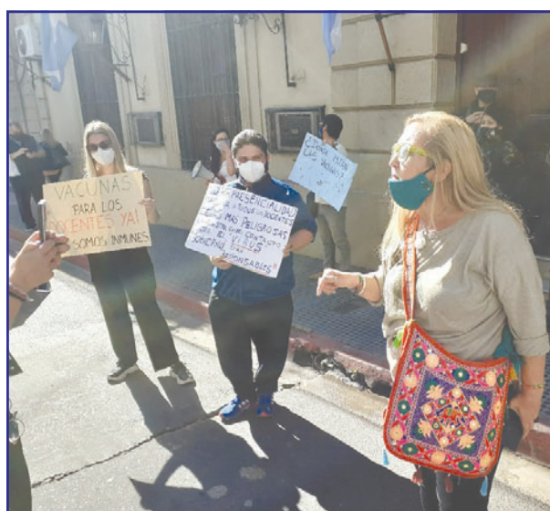
DESCONTEO. Maestros se movilizaron por el centro.

Que se complete el 100 por ciento del plan de va-