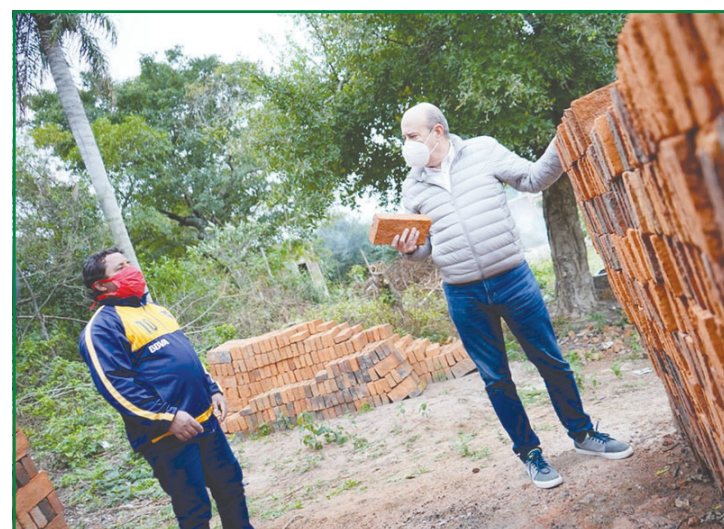
EN CONSTRUCCIÓN. El Vicegobernador edifica su campaña con recorridos.

gestión eficiente, y presente, por eso destacamos la participación ciudadana, cada vez más vecinos se suman a este proyecto para la ciudad", manifestó.